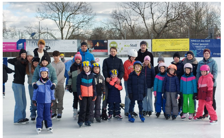
Viel Spaß am Eis mit dem KiJu-Team

Zum Abschluss des Semesters veranstaltete das KiJu-Team der Pfarre das mittlerweile schon traditionelle Eislaufen. Zahlreiche Kinder und Jugendliche drehten am Tullner Eislaufplatz ihre Runden. Pizza und wärmenden Tee rundeten den netten Tag ab.