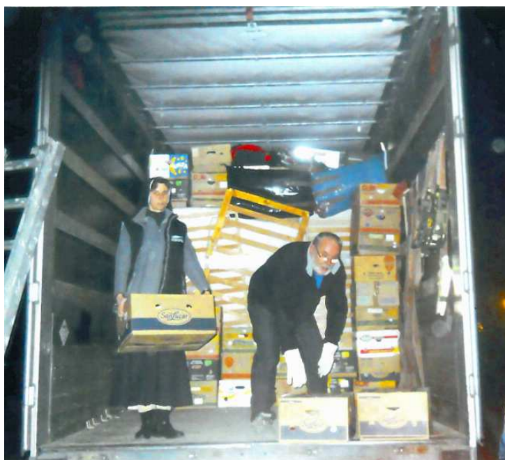
Entladen des LKW-Zuges

Wenn möglich, die Sachen in Bananenkartons verpacken. Wie bei den vorausgegangenen Kleidersammlungen wird auch um eine Spende für den Transport nach Rumänien gebeten.